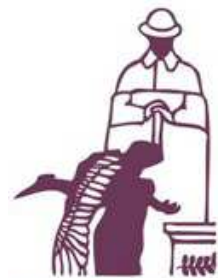
Langemark - Poelkapelle

Oproep aan alle leden en sympathisanten van de Ambachtelijke Smedersgilde van België vzw om op 10 en 11 november een wake te houden aan het door een internationaal smedersgezelschap in 2016 vervaardigd monument ter nagedachtenis voor alle gesneuvelden van wereldoorlog 14-18.